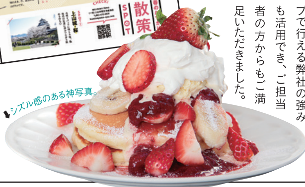
↓ シズル感のある神写真。

安全、安心に楽しむ かみのやまのおすすめグルメ！ 上山市で2021年の夏から実施してきた「上山市安全対策強化経済活動支援金」の取り組み。山形県新型コロナウイルス対策認証制度の認証取得や、さらに認証取得事業者が行うプロモーション等を支援する制度です。ちょうど2月28日をもって申請受付を終了するというところで、活用した飲食店をピックアップし、タイアップ特集で誌面展開。