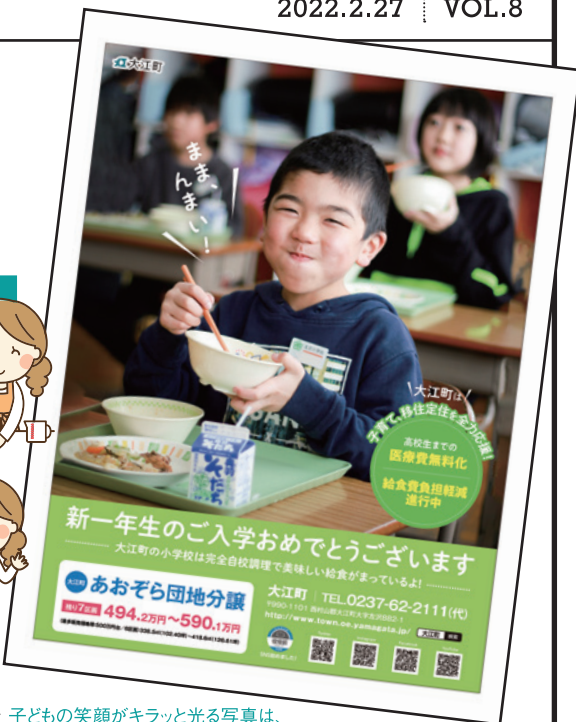
↑ 子どもの笑顔がキラッと光る写真は、弊社カメラマンにぜひお任せください！ マーメイド表紙の撮影も担当するスタッフです（今回写真は、自治体様に支給いただいたものです）。